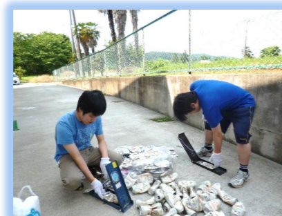
アルミ缶リサイクル

多目的トイレを利用し、トイレ介助を行います。また、失禁した場合はシャワー室を利用し、衛生面での支援を行い、気持ちよく過ごしていただくためのサポートを行います。