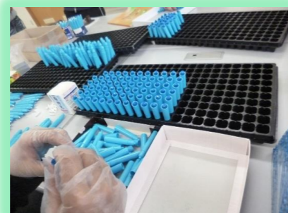
サインペンの組み立て作業

サインペンの組み立てやアルミ缶リサイクルを中心に一部作業を提供するとともに、ドライブや散歩、創作活動など利用者のペースに合わせた活動を実施しています。