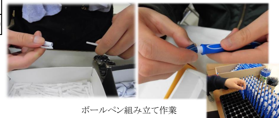
ボールペン組み立て作業

自分たちが作った物がお店に並んだり、身近なところで使われていることを知ることで、社会の一員としての実感を得ることが出来ます。