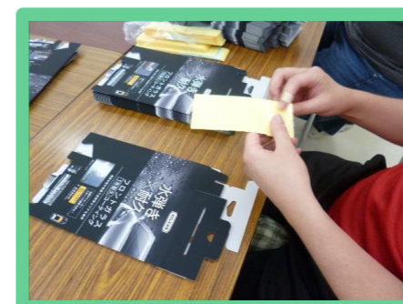
シール貼り・組み立て作業