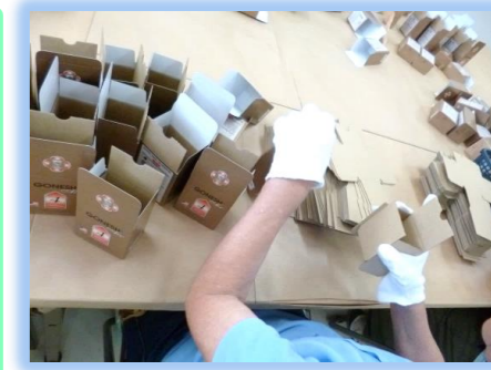
箱の組み立て作業